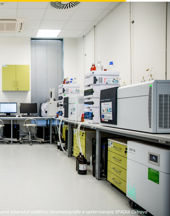
vaná laboratoř oddělení chromatografie a spektroskopie SPADIA Ostrava

Pro stanovení obou vitaminů používáme v laboratořích Spadia zlatý standard, což je kapalinová chromatografie s UV detekcí. Měření probíhá jednou týdně.