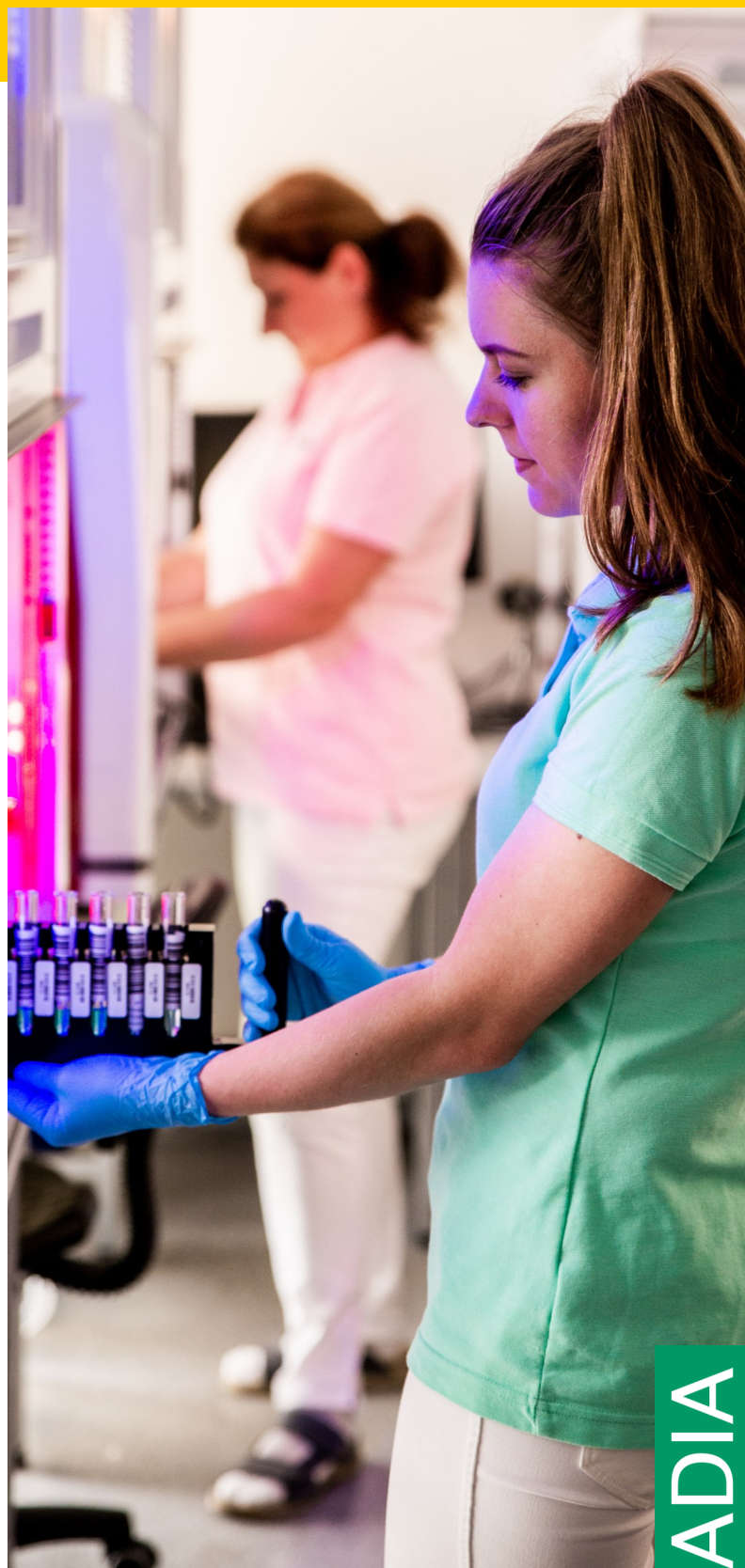
Oddělení molekulárně-biologických metod SPADIA Ostrava